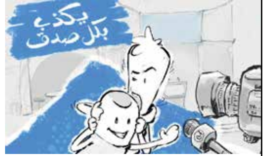
ليعذرنا الزميل الغالي الشاعر ابو تمام

خيانة إرادة الناخبين: الناخب صوت للناخب بسبب برنامج حزبه وتوجهاته. عندما ينتقل الناخب لحزب آخر، يكون قد استخدم أصوات الناخبين لدعم سياسات لم يوافقوا عليها أصلاً. 2. تغيير موازين القوى البرلمانية : في حكومات الأقلية كالحالة الكندية الآن، كل مقعد يحسم. انتقال عدة نواب للحزب الحاكم قد يمنحه أغلبية لم يحصل عليها في صناديق الاقتراع، وهذا يُفرغ الانتخابات من معناها. 3. باب مفتوح للفساد والإغراء: يشير