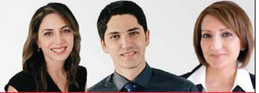
Masi Real Estate Broker