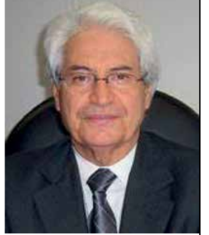
أعلن أصدقاء وطلاب البروفيسور

عاطف قبرصي عن تأسيس منحة دراسية في جامعة ماكماستر (وفيما بعد تبنيتها الجامعة) ، احتفاءً بالإرث العالمي المستمر للدكتور قبرصي . ابتداءً من عام 2024 ، ستمنح منحة الدكتور عاطف قبرصي الدراسية سنوياً لطالب جامعي حصل على متوسط عالٍ في برنامج الفنون والعلوم أو باعتباره تخصصاً في الاقتصاد. سوف تتناوب المنحة بين الطلاب في برنامج الفنون والعلوم وفي الاقتصاد. يشرفنا أن ندعو مساهمتكم إلى هذا الإرث الدائم. سيتم مطابقة الهدايا المقدمة للصفحة بمبلغ إجمالي يصل إلى $25000.