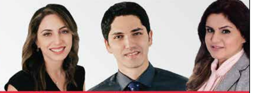
Masi Real Estate Broker