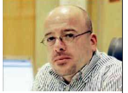
في مقدّمة كتابه "كيفما فكرت.. فكر العكس" يشرح الكاتب البريطاني بول أردن فوائد القرارات الخاطئة، ويبين كيف أنّ المجازفة

هي أمائك في الحياة، ولماذا اللاعقلانية أفضل من العقلانية، "فالسّر في امتلاك الثقة لرمي النرد". الفكرة الأهم في هذا الكتاب، وفيه الكثير من الأفكار المهمة والمثيرة بلا ريب، هي حكاية لاعب أولمبي يوردها الكاتب على النحو التالي: قبل الألعاب الأولمبية التي نُظمت في المكسيك، اعتاد أبطال القفز العالي الطيران فوق العارضة، جاعلين أجسادهم موازية لها. وسُميت هذه التقنية "الدرجة الغربية". لكن ذلك كان على وشك أن يتغير. قارب رياضي غير معروف العارضة المنصوبة على ارتفاع قياسي هو متران وأربعة وعشرون سنتيمتراً، بطريقة مغايرة تماماً. انطلق وبدل أن ينحني بصدده في اتجاه العارضة، وأولها ظهره.