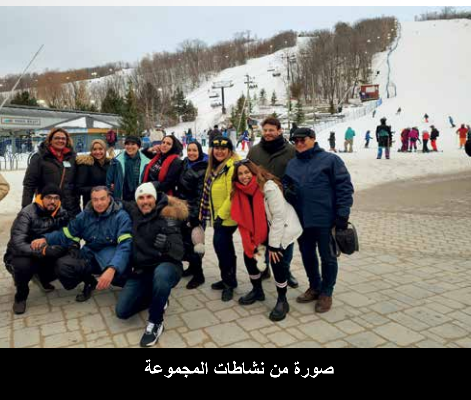
صورة من نشاطات المجموعة

تعزيز التواصل مع اعضاء الجالية و خدمتهم.