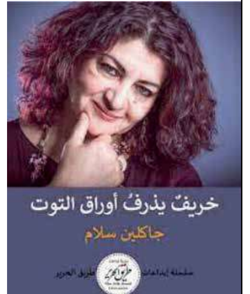
خريف يذرف أوراق التوت

كرسي قديم أسود، طاولة صغيرة وفوقها مفتاح ودولار. العصا ومستلزمات الصيد التي كان يحملها الشيخ العجوز وهو ذاهب الى الصيد في البحيرة المجاورة. جاري الاسود العجوز كف عن الذهاب للتسليية والصيد. قال لي: انا اصيد السمك ولكنني لا أكل منه، هل تريدون بعض السمك؟ قلت: لا، شكرا، لا أثق بأسمك البحيرات القريبة. قلت له مرات عديدة لو احتجت الى أي شيء، اقرع باب شقتي. قرع مرة الباب وطلب مني أن (أترد له الابرة والخيط)... تركته على الباب ودخلت أبحث عن النظارات. اتصلت صديقة لي فقلت لها: عفوا مشغولة مع جاري والابرة والخيط، فسخرت من الموضوع وقالت: العجوز يتحرش بك، على ما يبدو... كان هذا اخر ما قد أتوقع سماعه منها. جاري الذي قبل ان يموت استعرت منه مقبعا كي أتقب الجدار وأثبت عليه بعض اللوحات التي اشتريتها. الجدار (كونكريت) لم استطع ان أتقبه. حاول هو بيده المقفولة المريضة ان يساعدني ولم يقدر... قال: هذا المثقب قديم عتيق مثلي. سألته كم عمرك: ضحك وقال: انا عتيق وأصبحت