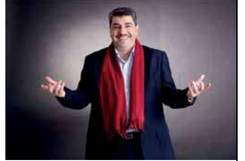
تفوز المغرب فترقص الأردن ، تقصف غزة فتنتفض الجزائر ، تخسر قطر فتبكي تونس

.. هكذا نحن العرب ، دمنا واحد ، نبضنا واحد ، فرحنا واحد ، شغفنا واحد ، حزننا واحد .. لسنا بحاجة إلى زيارات رسمية بين البلدين حتى نتقوى علاقاتنا ، دمة توحدنا ، ضحكة توحدنا ، كرة قدم توحدنا ، الطفل "ريان" المغربي يوحدنا ، الشهيد الطفل حمزة الخطيب السوري يوحدنا .. "سايكس بيكو" مجرد حبر على خريطة ، من جعلها حدوداً وجنوداً وخنادق وبنادق وأسلاك شائكة ، خدامهم وعبيدهم وصغارهم ممن يعتلون كراسي الحكم عنوة عن إرادة الشعوب .. أما نحن الأمة العربية الواحدة لا نحتاج إلى "وكلاء" أبداً لا