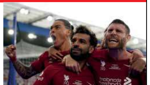
توج فريق ليفربول بالدرع الخيرية للاتحاد

الانجليزي لكرة القدم بعد فوزه على مانشستر سيتي بثلاثة أهداف مقابل هدف واحد مساء السبت 30 تموز يوليو. وتجمع مباراة درع الاتحاد في بداية الموسم الجديد بين بطل الدوري والفائز بكأس الاتحاد. وبدأ ليفربول، الذي دخل دون لاعبي الجديد، داروين نونيز، المباراة بسرعة وتحكم أكثر في الكرة، ومارس ضغطا متقدما على الفريق المنافس. وخلق الفريق الأحمر العديد من فرص التسجيل منذ الوهلة الأولى. وتوجت جهود لاعبيه بهدف سجله