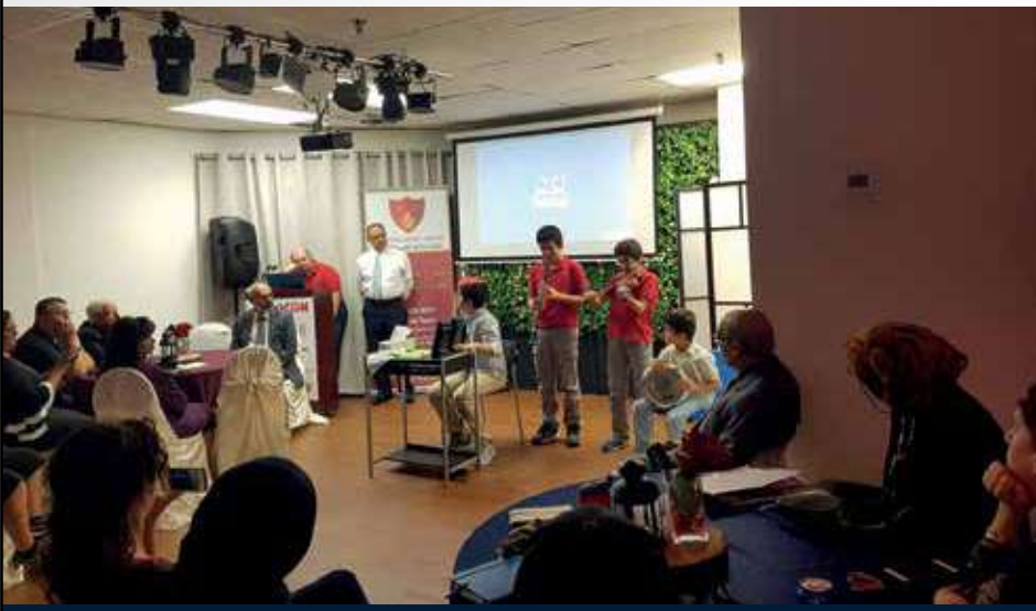
من نشاطات الفرقة للأطفال

والى أي مدى أعاقت تلك التحديات إمكانية تحقيق الأهداف على النحو المأمول؟