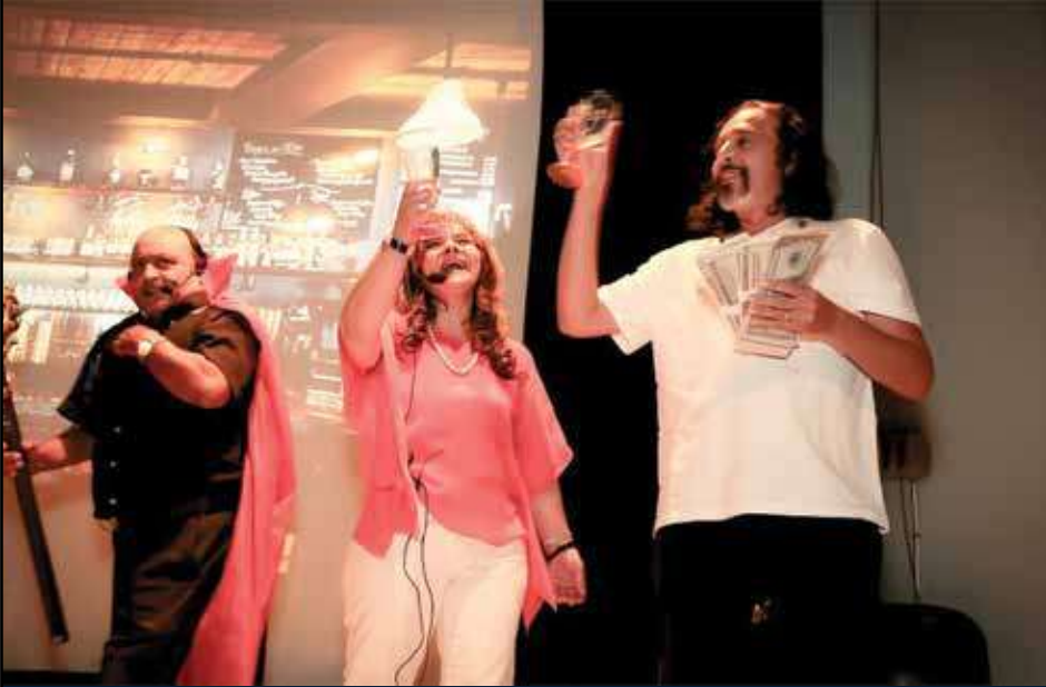
من نشاطات الفرقة - مسرحية القناع