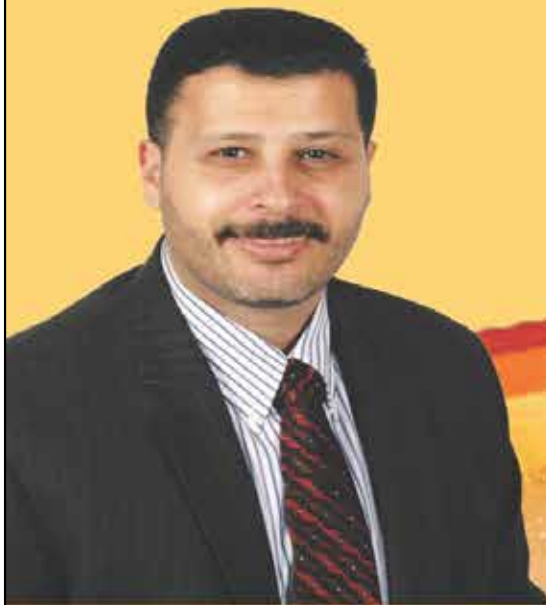
Immigration Consultant (RCIC) Commissioner of Oath

Tel: 647.405.0517 Email: ahmadshahab@rogers.com Canada & USA 1 800.550.6945 ext 107