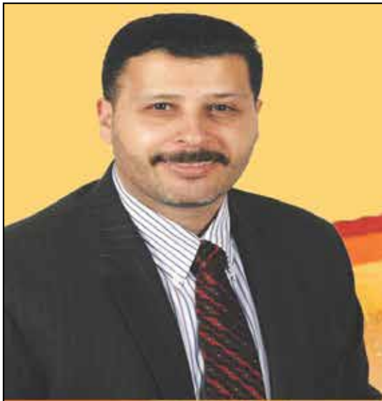
Immigration Consultant (RCIC) Commissioner of Oath

تبقى صحة وسلامة وأمن الكنديين على رأس أولوياتنا. حيث عززت كندا الفحص الصحي على حدودها بالإضافة إلى عمليات المراقبة واجراءات الإنفاذ، وستستمر في اتباع مشورة مسؤولي الصحة العامة عن كذب بينما نقوم بالترحيب بالوافدين الجدد. تترك هذه الخطة المتعددة السنوات أهمية لم شمل الأسرة والتزام كندا العالمي بحماية الأشخاص الأكثر عرضة للخطر من خلال إعادة توطين اللاجئين. تتضمن الخطة النقاط التالية: • زيادة في قبول الطلبات على مدى ثلاث سنوات من الخطة • تعويض النقص لعام 2020 • التركيز على النمو الاقتصادي، حيث تشكل الطبقة الاقتصادية 60